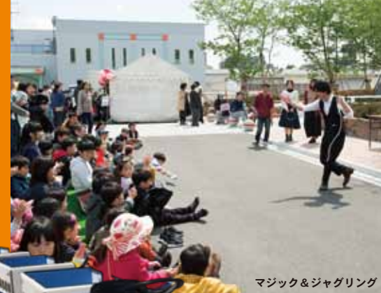
マジック&ジャグリング

花びより フォトコンテスト開催 「花びより金剛寺」を撮影した写真を大募集！ 詳しくは念法真教ホームページで。