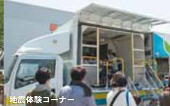
地震体験コーナー