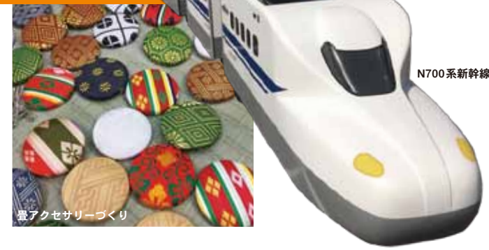
畳アクセサリーづくり